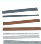
GS F09 GS油石(Made in Japan) GS EDM STONES